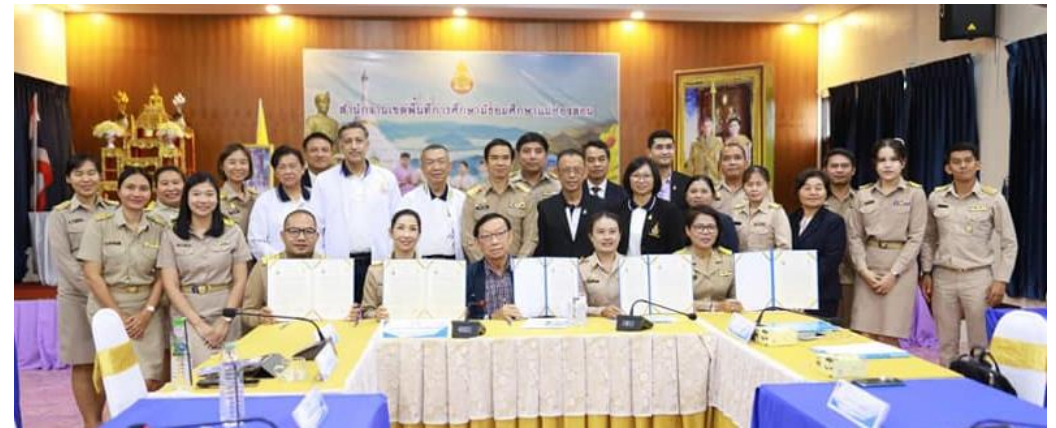
เขตสุขภาพที่ ๑ จังหวัดแม่ฮ่องสอน ในวันจันทร์ที่ ๑๓ พฤศจิกายน ๒๕๖๖ ณ สำนักงานเขตพื้นที่การศึกษามัธยมศึกษาแม่ฮ่องสอน (ผู้จัดงานหลัก วพบ.เชียงใหม่)