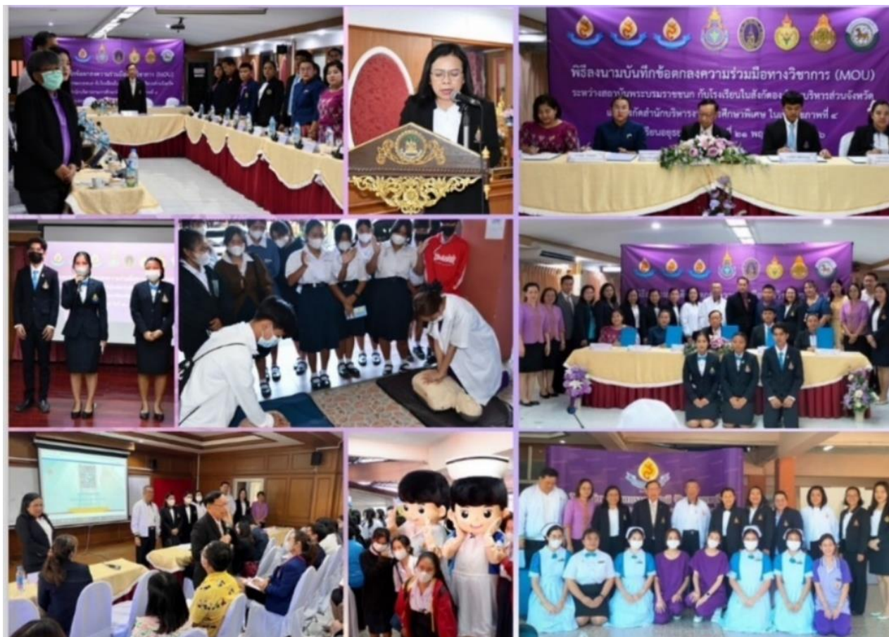
เขตสุขภาพที่ ๔ จังหวัดพระนครศรีอยุธยา ในวันอังคารที่ ๒๑ พฤศจิกายน ๒๕๖๖ ณ โรงเรียนอยุธยานุสรณ์ (ผู้จัดงานหลัก วพบ.จังหวัดนนทบุรี)