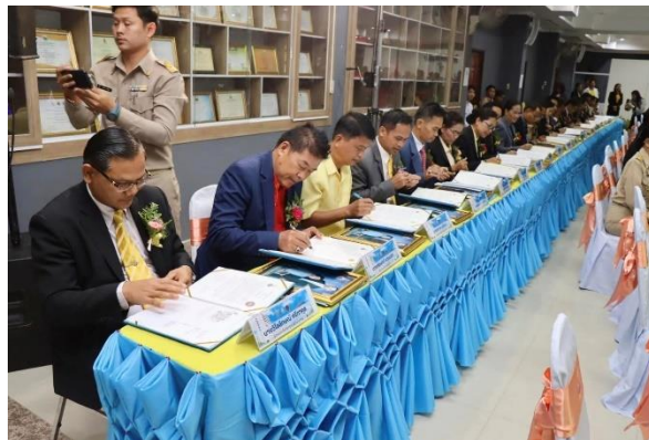
เขตสุขภาพที่ ๑๐ จังหวัดศรีสะเกษ ในวันจันทร์ที่ ๔ ธันวาคม ๒๕๖๖ ณ โรงเรียนไพร่บึงวิทยาคม (ผู้จัดงานหลัก วพบ.สรรพสิทธิประสงค์)