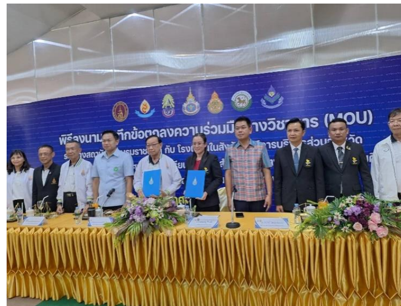
เขตสุขภาพที่ ๗ จังหวัดมหาสารคาม ในวันอังคารที่ ๑๔ พฤษภาคม ๒๕๖๖ ณ โรงเรียนท่าขอนยางพิทยาคม (ผู้จัดงานหลัก วพ.ศรีมหาสารคาม)