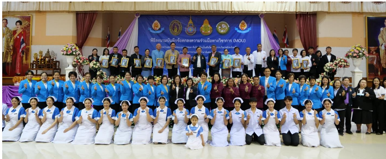
เขตสุขภาพที่ ๒ จังหวัดเพชรบูรณ์ ในวันพฤหัสบดีที่ ๒๖ ตุลาคม ๒๕๖๖ โรงเรียนองค์การบริหารส่วนจังหวัดเพชรบูรณ์ (วังชมภูวิทยาาคม) (ผู้จัดงานหลัก วพบ.พุทธชินราช)