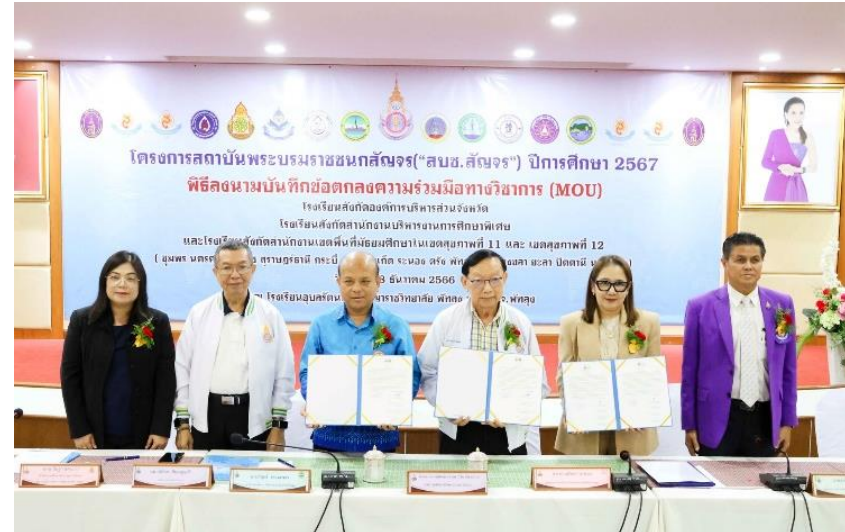
เขตพื้นที่สุขภาพที่ ๑๑ - ๑๒ จังหวัดพัทลุง ในวันศุกร์ที่ ๘ ธันวาคม ๒๕๖๖ ณ โรงเรียนอนุบาลรัตนราชกัญญาราชาวิทยาลัย พัทลุง (ผู้จัดงานหลัก วพบ.สงขลา)