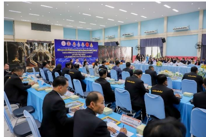
เขตสุขภาพที่ ๙ จังหวัดนครราชสีมา ในวันที่พฤหัสบดีที่ ๒๓ พฤศจิกายน ๒๕๖๖ ณ โรงเรียนเตรียมอุดมศึกษา นครราชสีมา (ผู้จัดงานหลัก วพบ.นครราชสีมา)