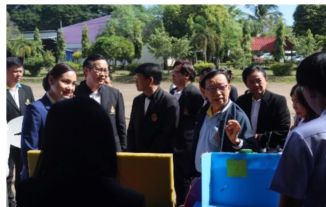
เขตสุขภาพที่ ๑ จังหวัดน่าน ในวันศุกร์ที่ ๑๗ พฤศจิกายน ๒๕๖๖ ณ โรงเรียนตาลชุมพิทยาคม (ผู้จัดงานหลัก วพบ.แพร่)