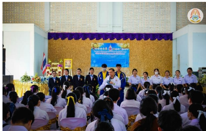
เขตสุขภาพที่ ๕ จังหวัดกาญจนบุรี ในวันศุกร์ ๒๐ ตุลาคม ๒๕๖๖ ณ โรงเรียนองค์การบริหารส่วนจังหวัดกาญจนบุรี ๑ (บ้านเก่าวิทยา) (ผู้จัดงานหลัก วพ.พระจอมเกล้า จังหวัดเพชรบุรี)