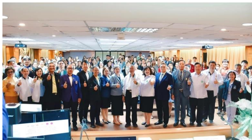
เขตสุขภาพที่ ๘ จังหวัดสกลนคร ในวันพุธที่ ๑๕ พฤศจิกายน ๒๕๖๖ ณ โรงเรียนเตรียมอุดมศึกษา ภาคตะวันออกเฉียงเหนือ (ผู้จัดงานหลัก วพบ.อุดรธานี)