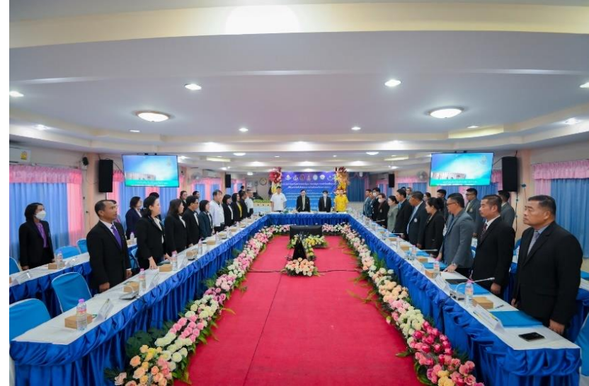
เขตสุขภาพที่ ๖ จังหวัดปราจีนบุรี ในวันที่ ๒๒ พฤศจิกายน ๒๕๖๖ ณ โรงเรียนเตรียมอุดมมถ่อมเกล้า กบินทร์บุรี (ผู้จัดงานหลัก วิทยาลัยการแพทย์แผนไทยอภัยภูเบศร จังหวัดปราจีนบุรี)