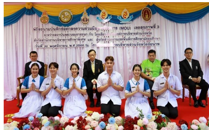
เขตสุขภาพที่ ๓ จังหวัดฉะเชิงเทรา ในวันจันทร์ที่ ๒๐ พฤศจิกายน ๒๕๖๖ ณ โรงเรียนนวมินทราชินยาจังหวัดฉะเชิงเทรา (ผู้จัดงานหลัก วพบ.ฉะเชิงเทรา)