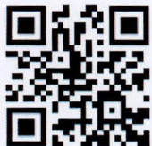
แบบฟอร์มหนังสือมอบอำนาจ